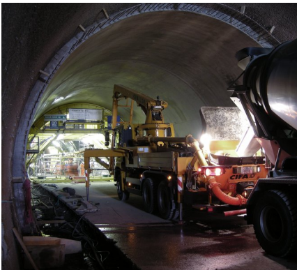
Betonieren des Innengewölbes